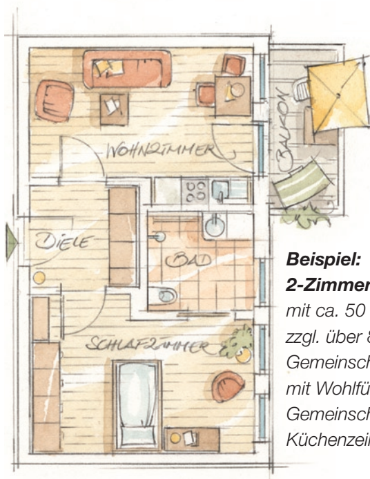
Beispiel: 2-Zimmer-Wohnung mit ca. 50 m 2 Wohnfläche zzgl. über 80 m 2 Gemeinschaftsfläche u.a. mit Wohlfühlbad, großem Gemeinschaftsraum mit Küchenzeile und Balkon

Die CaraVita – Experten für Wohnen im Alter aus Prien entwickelte das Gesamtkonzept und unterstützt als Initiator auch den Aufbau der ABWG. Dafür fallen für die Bewohner keine zusätzlichen Kosten an.